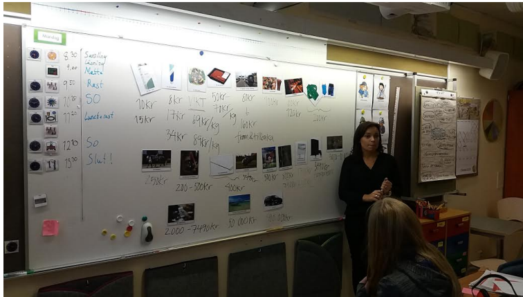
Gemensam uppföljning av elevernas kostnadsstege.